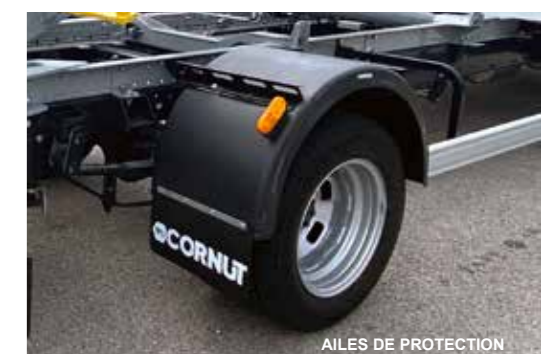
AILES DE PROTECTION