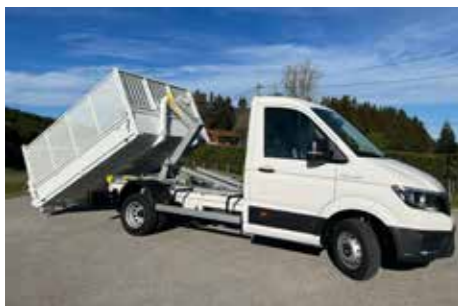
MAN - TGE