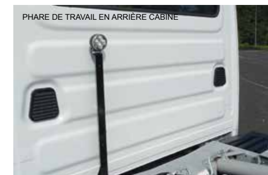
PHARE DE TRAVAIL EN ARRIÈRE CABINE