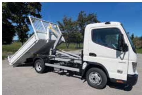
FUSO - Canter