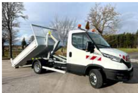
IVECO - Daily