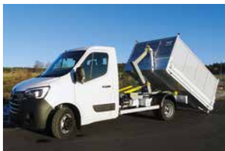
RENAULT - Master