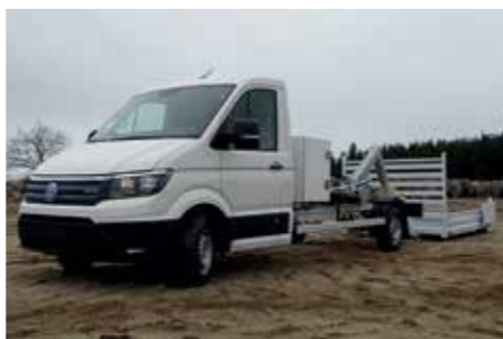
VOLKSWAGEN - Crafter