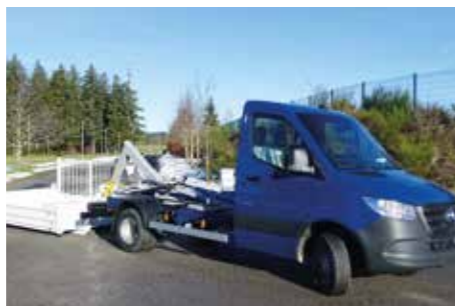
MERCEDES BENZ - Sprinter