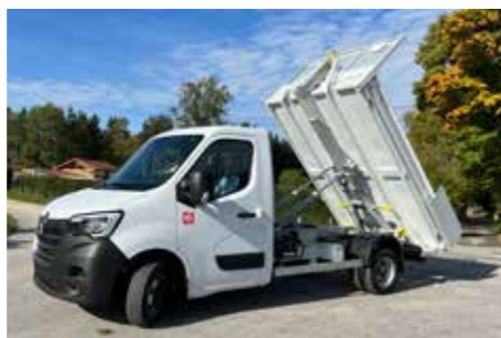
RENAULT TRUCKS - Master