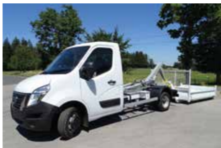
NISSAN - Interstar