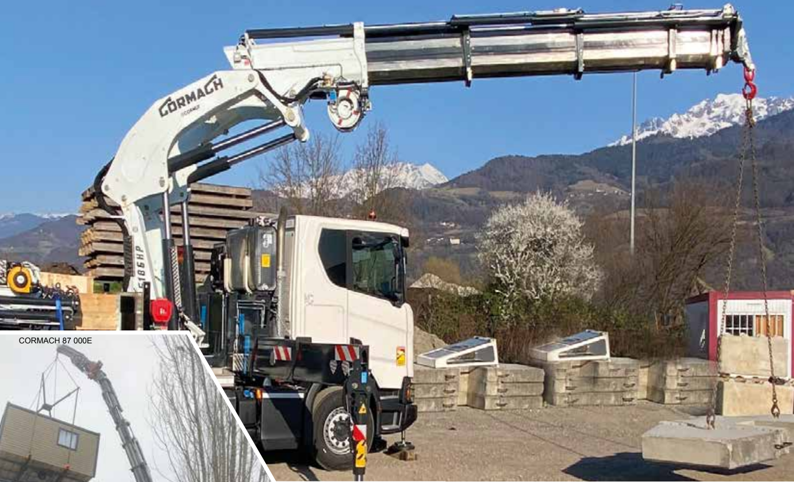
CORMACH 87 000E