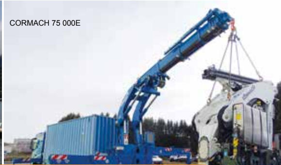
CORMACH 75 000E