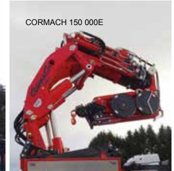
CORMACH 150 000E