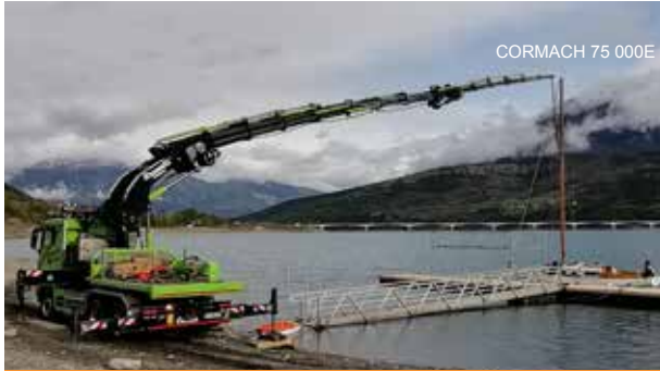
CORMACH 75 000E